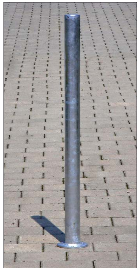
Sperrpfosten zum Aufdübeln, verzinkt